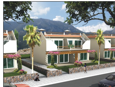
Sky Blue Villa £75,900

Chelsey Village bietet Ihnen eine absolut neue Einfamilienhaussiedlung mit einer ausgezeichneten Infrastruktur und einer breiten Auswahl an unterschiedlichen Immobilienobjekten.