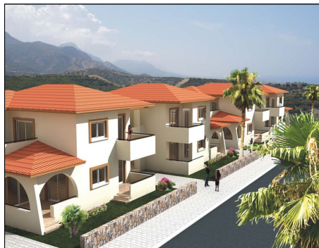
Rainbow Haus £59,900