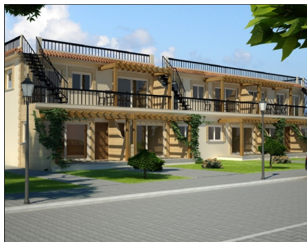
Cobalt Haus £38,500